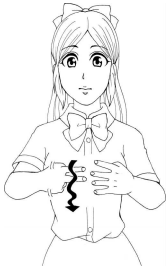
季節がめぐる様子