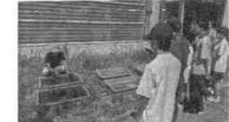
○セキショウモ移植