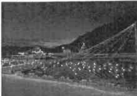
○ウィンターイルミネーション