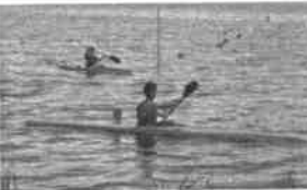
○小中生カヌー大会