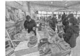
○ぼかぼかマルシェ