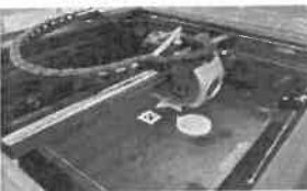
○キーホルダー作り