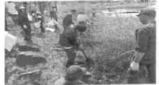
○メダカボランティア