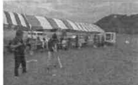
○ガストロノミーウォーク