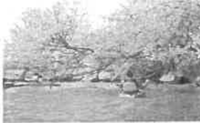
○お花見体験カヌー