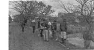
○冬鳥とサケの観察会