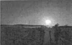
○サンセットウォーク