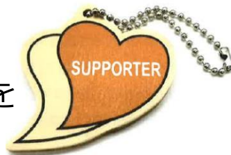
あいサポートキッズストラップ