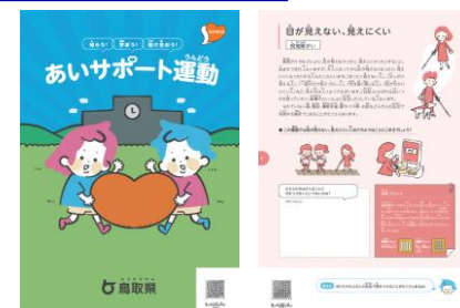
学習用教材（あいサポート運動 ハンドブック キッズ版）