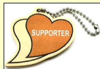
【あいサポートストラップ】