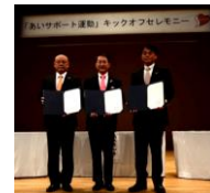
埼玉県富士見市及び三芳町(H26.10.16)