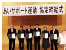
埼玉県秩父市及び周辺4町(H27.11.6)