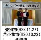
登別市(H28.11.27) 苫小牧市(H30.10.23) 北海道 4,522人