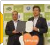
富士見市・三芳町 (H26.10.16) 秩父市・横瀬町・皆野町 長瀬町・小鹿野町 (H27.11.6) 狭山市(H30.7.3) 川口市(H31.1.17) 和光市(H31.1.17) 吉川市・松伏町(R2.5.25) 加須市(H31.11.15) 埼玉県 15,843人