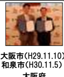
大阪市(H29.11.10) 和泉市(H30.11.5) 大阪府 5,843人