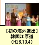
【初の海外進出】 韓国江原道 (H26.10.4)

あいサポーター数：586,119人 あいサポーター研修実施回数：8,698回 あいサポート企業・団体認定数：2,307企業・団体 (令和4年3月末現在)