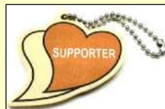
【あいサポートストラップ】