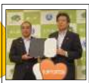
あいサポート運動連携協定締結