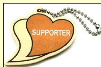
【あいサポートストラップ】