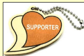
【あいサポートストラップ】