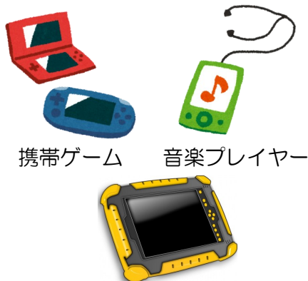
携帯ゲーム 音楽プレイヤー