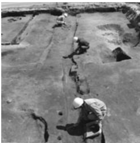
写真1 松河原上奥田第2遺跡調査風景

調査は平成22年8月18日から調査前地形測量を行い、8月23日に調査前航空写真撮影を行った。8月30日から31日に重機による表土剥ぎ作業を行った後、9月7日から発掘作業員の稼働を開始し、12