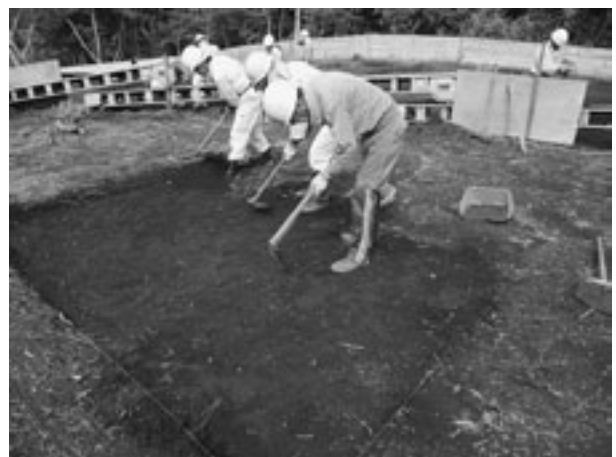
写真2 下市前築地遺跡調査風景