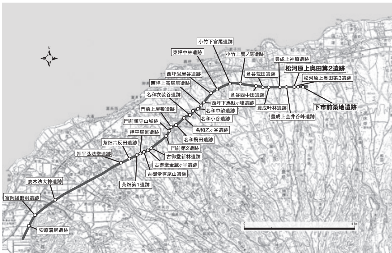
第1図 名和淀江道路関係遺跡位置図

平成22年度は小竹上鷹ノ尾遺跡3・4区及び2区の一部、松河原上奥田第2遺跡、下市前築地遺跡、