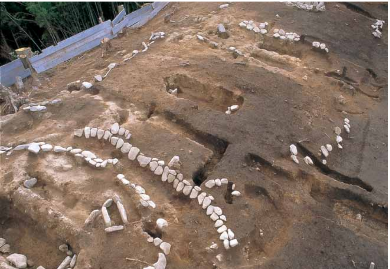
2 石井垣上河原3号墓(北西から)