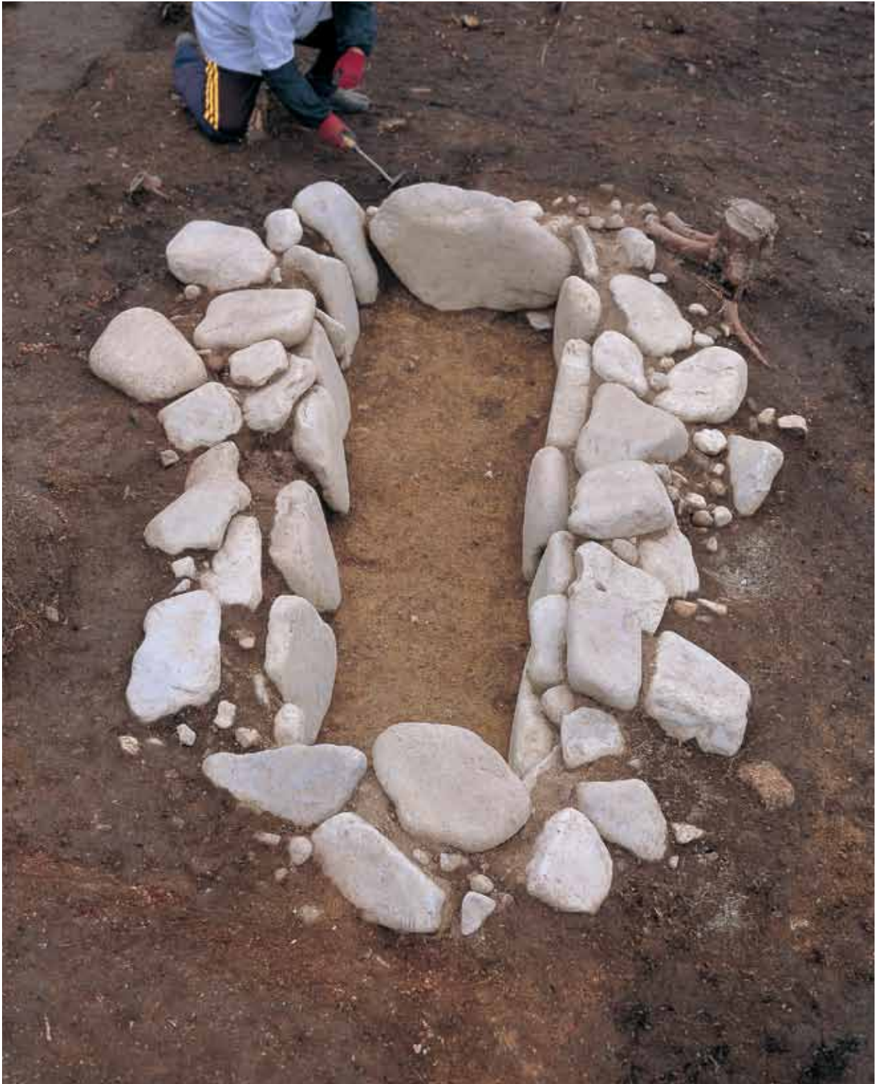
石井垣上河原4号墓埋葬施設1(東から)