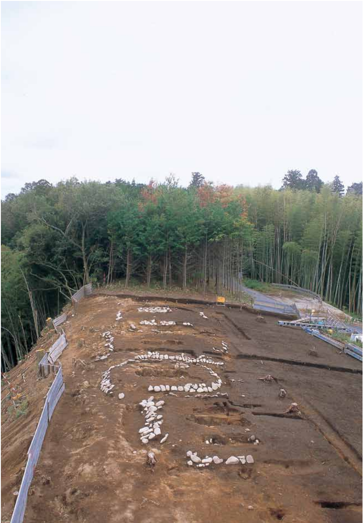
石井垣上河原墳墓群全景(北から)