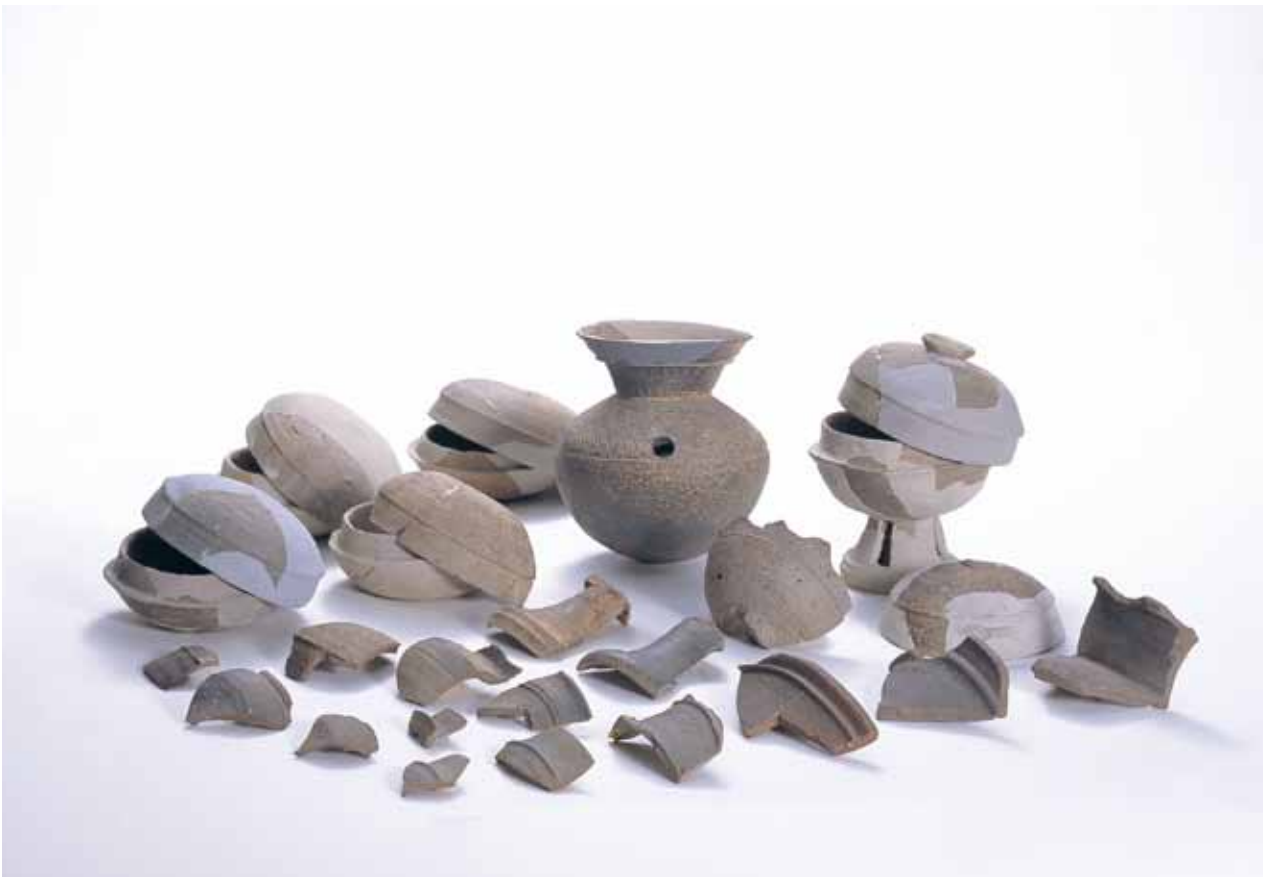
2 赤坂頭無し遺跡出土須恵器