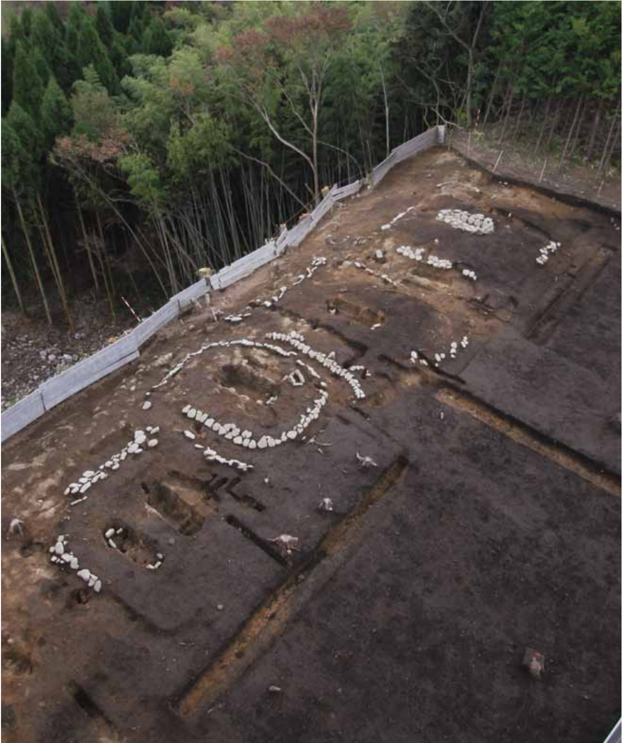
石井垣上河原墳墓群全景(北西から)