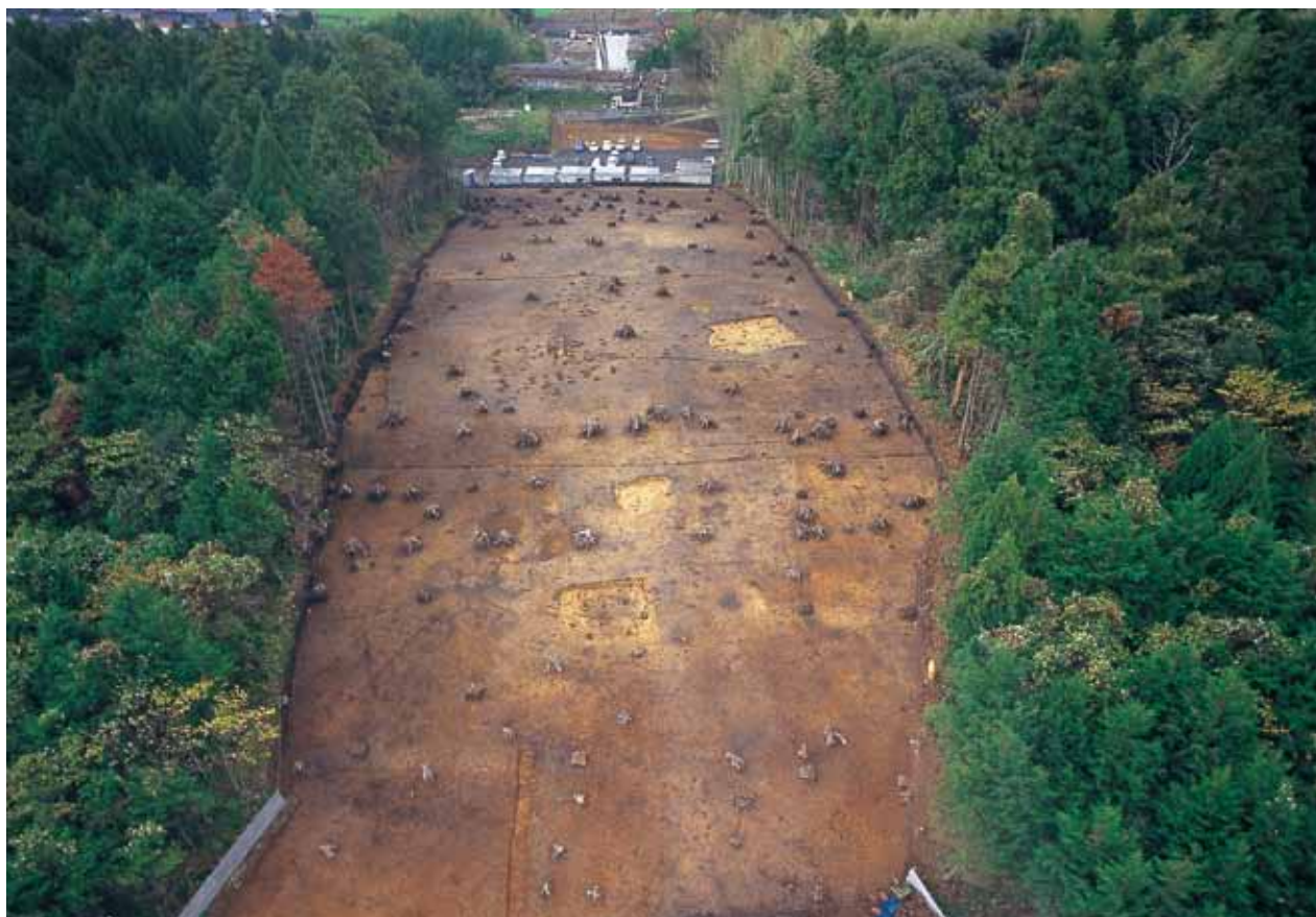
1 赤坂頭無し遺跡全景(西から)