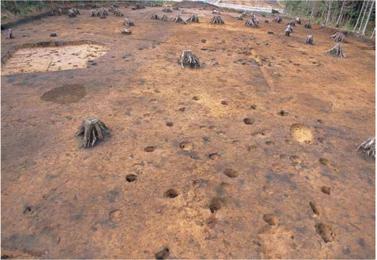
1 SB 1～3・SI 1 完掘状況(東から)