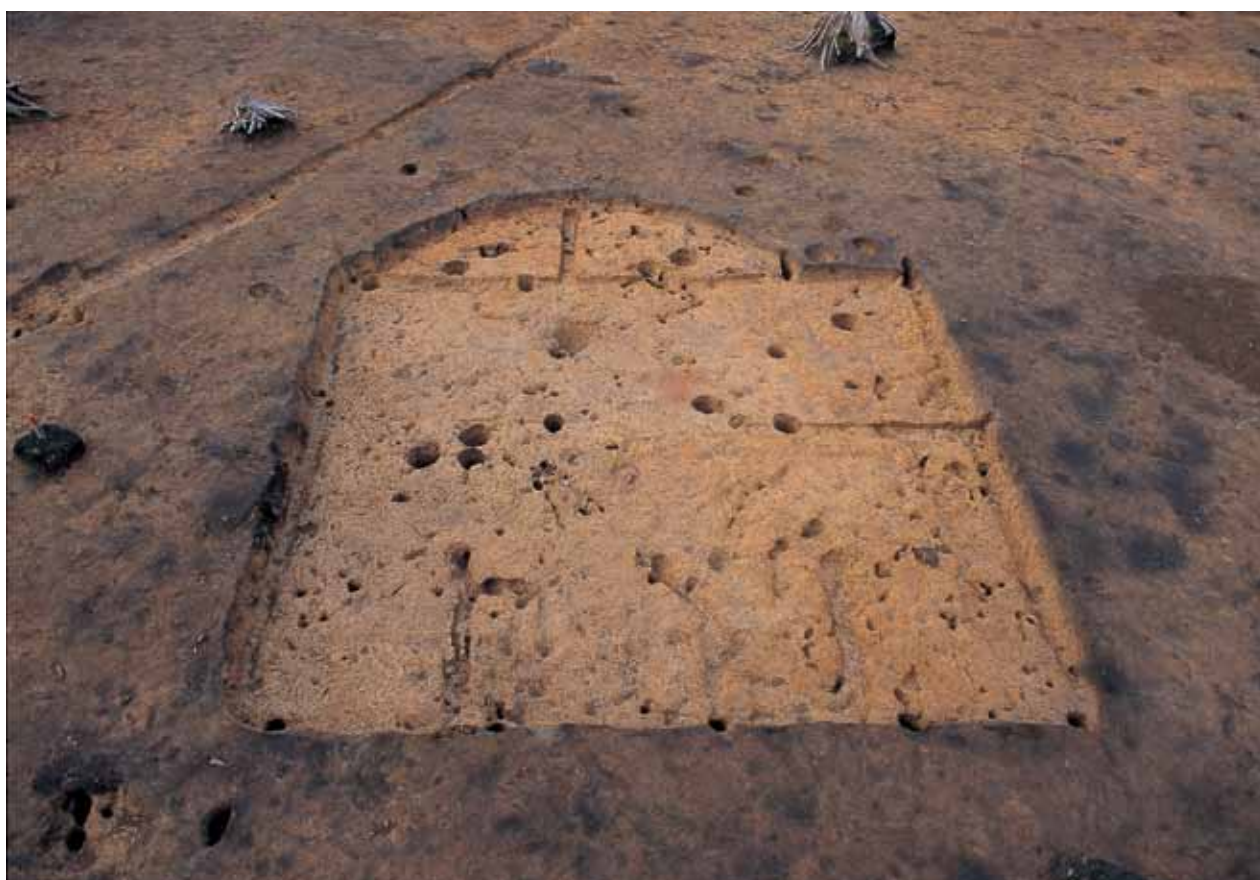
2 SI2・SI5完掘状況(南から)