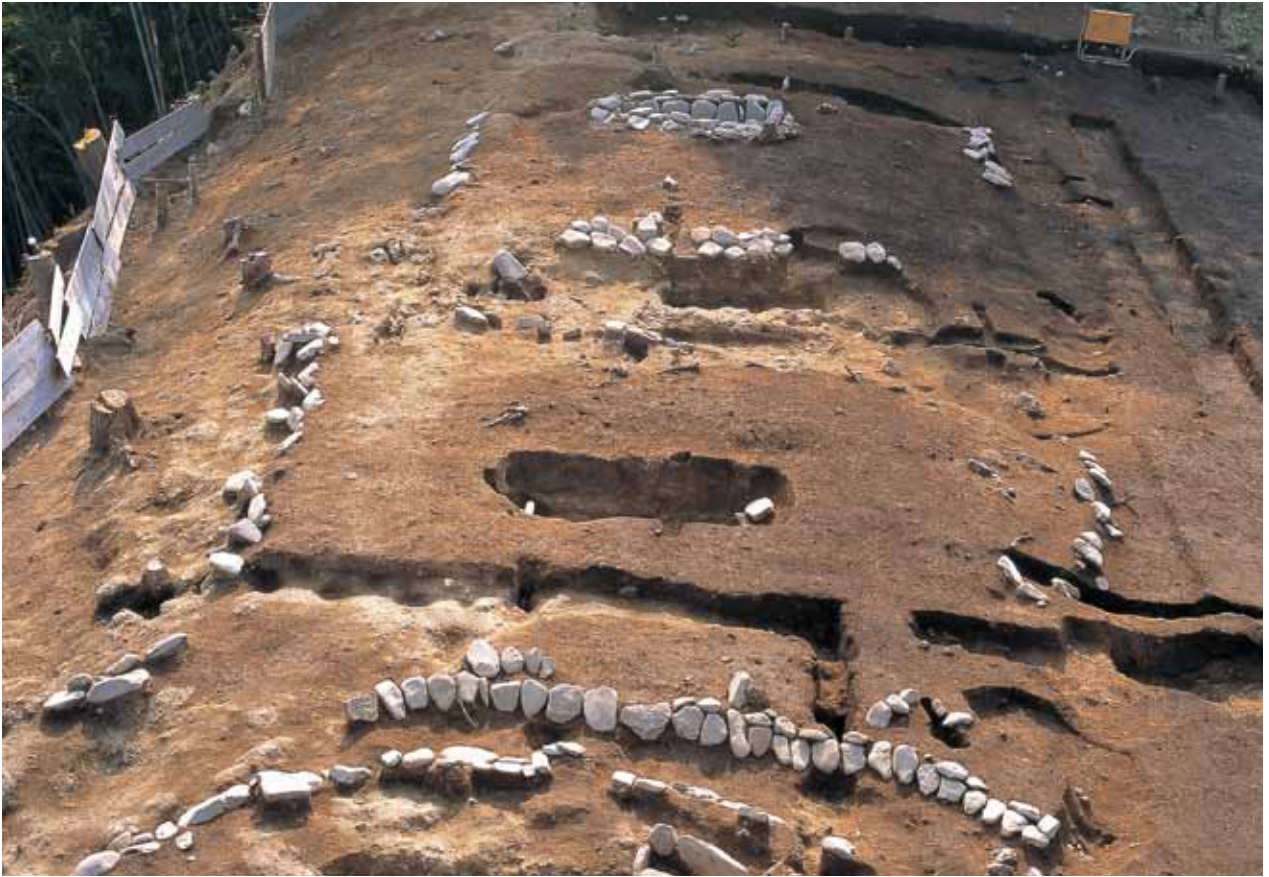
1 石井垣上河原3号墓・4号墓(北から)