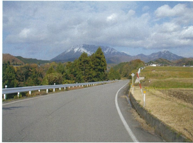
農道から大山南壁を望む

また、この農道の完成により、通作農産物輸送の利便性が向上するとともに、農村地域の集落間を連絡する生活道として、さらには防災上の代替道路としての役割も期待されています。