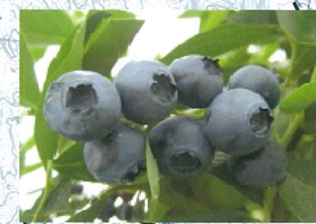
ブルーベリー(江府町)