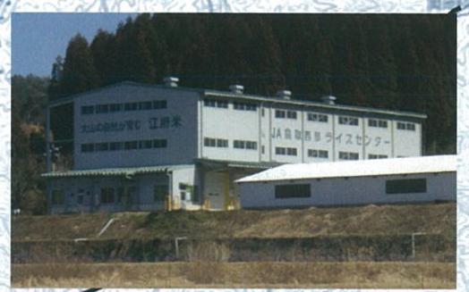
ライスセンター(江府町)