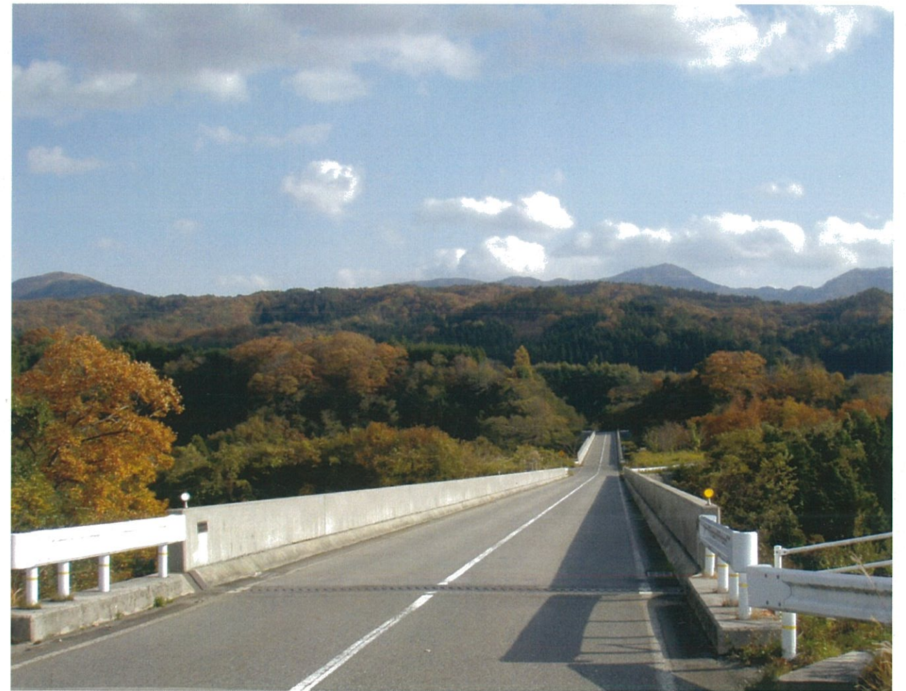
貝田大橋（貝田地内）