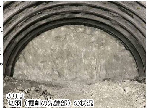
きりは切羽（掘削の先端部）の状況