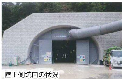
陸上側坑口の状況

トンネル掘削に伴い発生する土砂の運搬で多数ダンプトラックが走行し、近隣の皆様には大変ご迷惑をお掛けしており申し訳ありません。今後とも安全確保に努めてまいりますので、ご理解とご協力をよろしくお願いいたします。