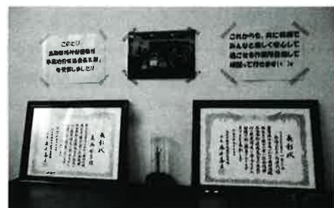
事業所に飾られた表彰状

ただ、ただ皆と一緒に過ごす安心感と、何を言っても許してくれる信頼感に、時に不安を感じることはあるが、ここに、こうして私たちがいることを知ってほしく、地域や各イベントなどに参加し、私たちの存在を知ってほしくてみんなのできるパフォーマンスを考え披露したことを評価してもらえたことを、うれしく思っています。