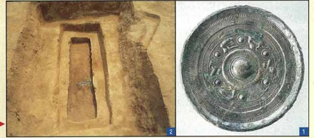
中国製の鏡が納められた木の棺の跡 (左) と発見された鏡 (右)