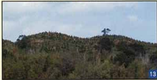
県西部最大の前方後円墳 (全長約 100m)