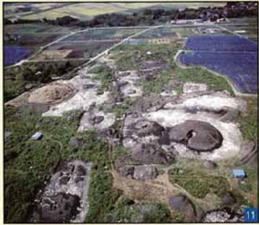
密集して造られた小さな古墳