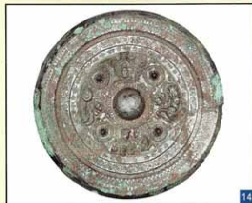
発見された中国製の鏡