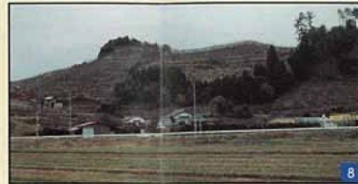
山陰最大の前方後円墳 (全長 110m)