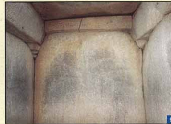
切石で造られた石室