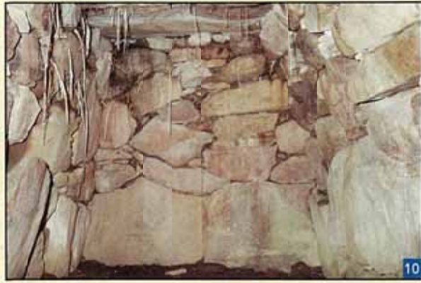
石を積み上げて造った石室