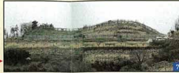
県内最大級の規模をもつ前方後円墳 (全長〈推定〉100m)