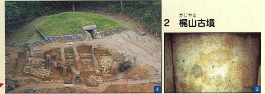
石垣が築かれた墳丘 (一部復元済み (左)) と石室内の壁画 (右)