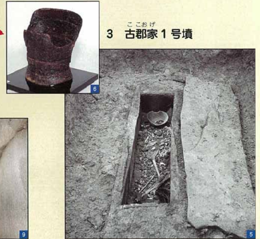
石の棺に納められていた遺体 (右) と鉄のよろい (左上)