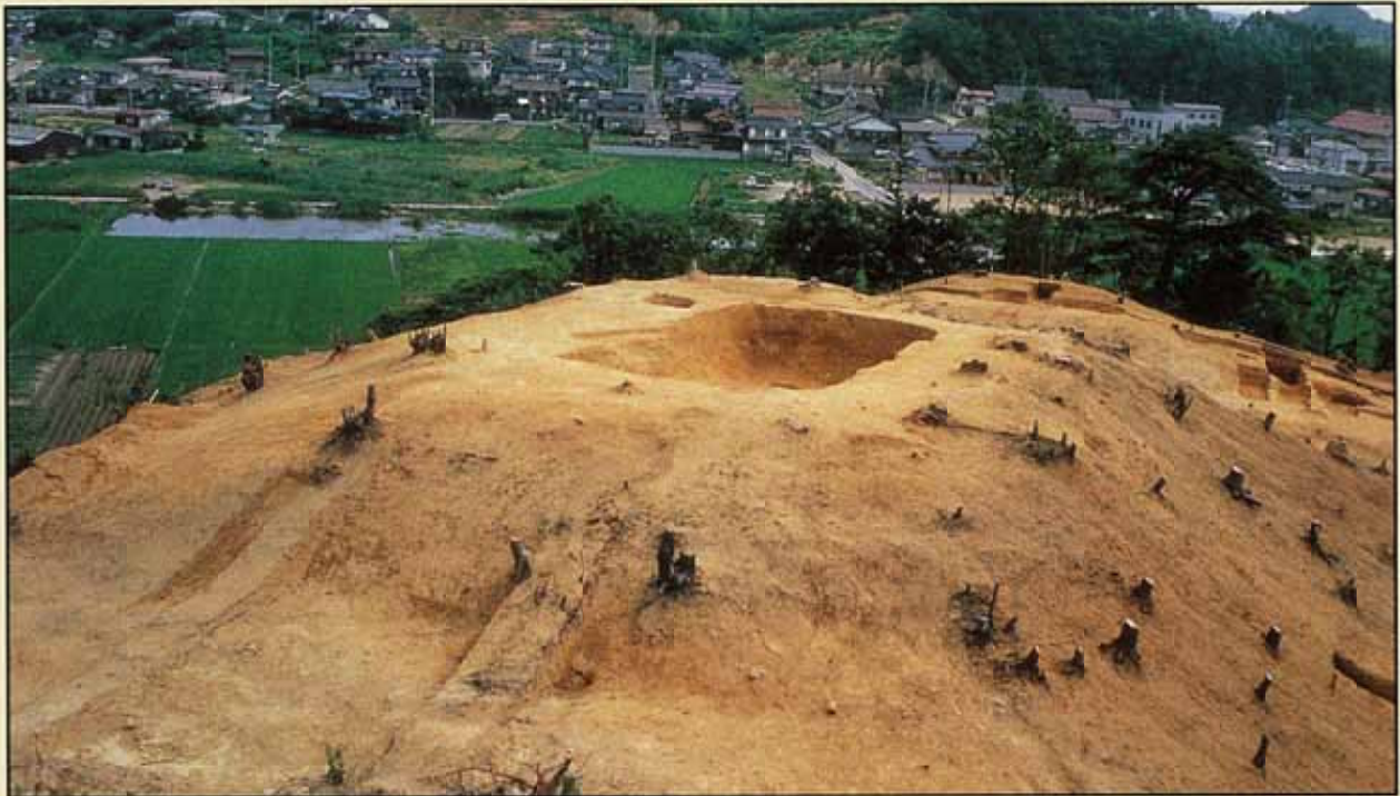
いなば ほうふん かつらみ 因幡地方最古の方墳 桂見2号墳（鳥取市）

今からおよそ 1700～1400 年前の間には、土を盛り上げて造った有力者の墓（古墳）が、北は岩手県から南は鹿児島県にいたるまで日本列島各地で造られました。この時代を古墳時代と呼んでいます。