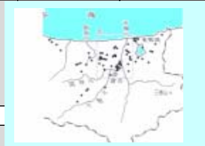
前方後円墳の位置