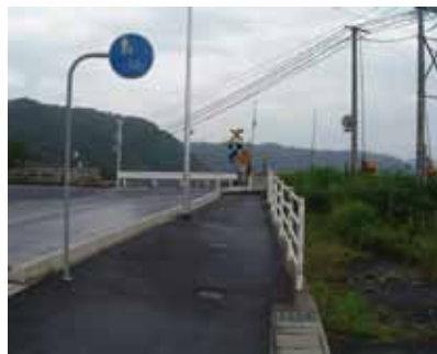
③T字路から約170m直進し、 右手にある踏切を渡ります。