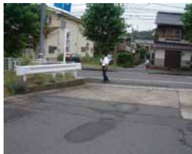
①青谷上寺地遺跡展示館 (現在地)の駐車場を出て左へ 向かいます。右手に山陰合同 銀行が見えます。