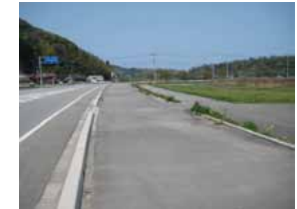
⑦交差点を渡って少し進むと、 右側に発掘調査現場が見えて きます。