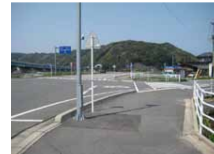
⑥信号のない交差点を渡ります。