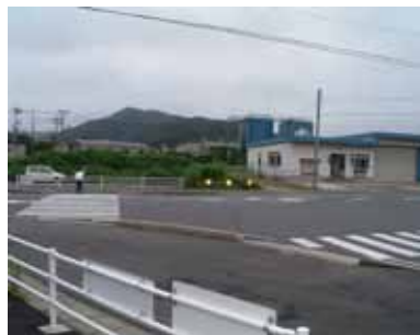
②突き当たり消防署がある T字路の横断歩道を渡り、左折 します。