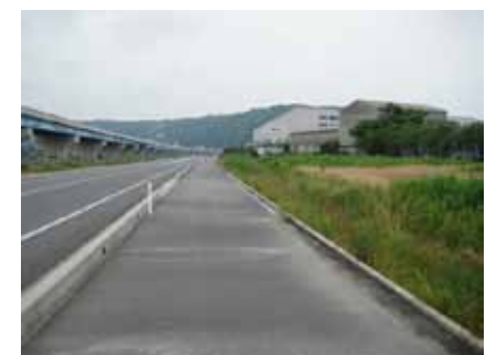
⑤工場を右側に見ながら歩道を西へ 約450m進みます。