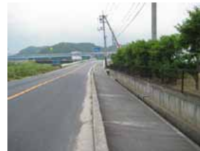
④踏み切りを渡り、約240m 直進します。ガソリンスタンドが 角にある交差点を右折します。