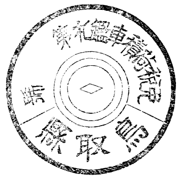
免稅荷積車ノ鑑札(木製ノ分)