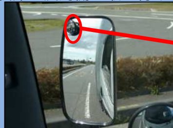
サイドミラーでは自動二輪車を確認できない。