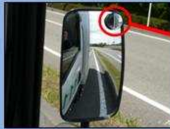
サイドミラーでは緊急車両を確認できない。