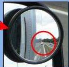
補助ミラーでは真後ろの緊急車両を確認できる。