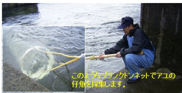
図2 アユ流下仔魚採集風景

調査は天神川の天神ノ森付近で、概ね夕方6時から夜10時頃まで、1時間おきにプランクトンネットを曳いてアユ仔魚を採捕します。