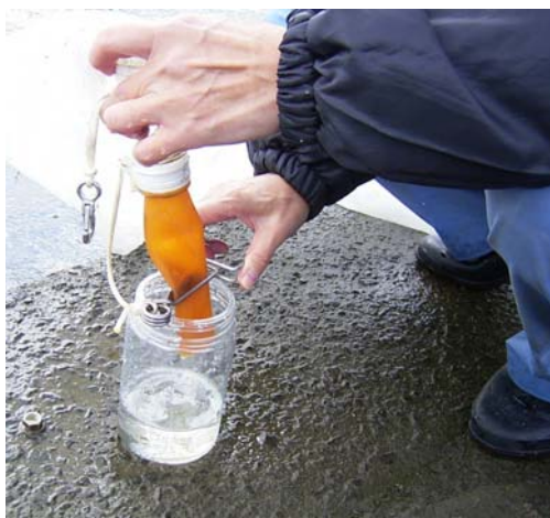
図1 アユ仔魚採集風景 (サンプル瓶に入れてセンターに持ち帰ります)

アユは10月頃から産卵を開始し、10月の終わり頃からふ化仔魚が川を下って行きます。栽培センターでは、アユがどのくらい生まれたのか推定するために、天神川で流下仔魚調査を行っています。