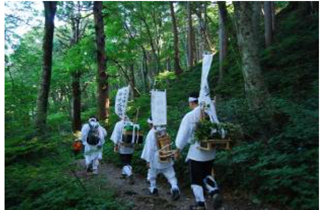
霊水と薬草を背負い下山