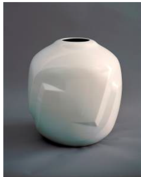
白瓷面取壺 1991 鳥取県立博物館所蔵