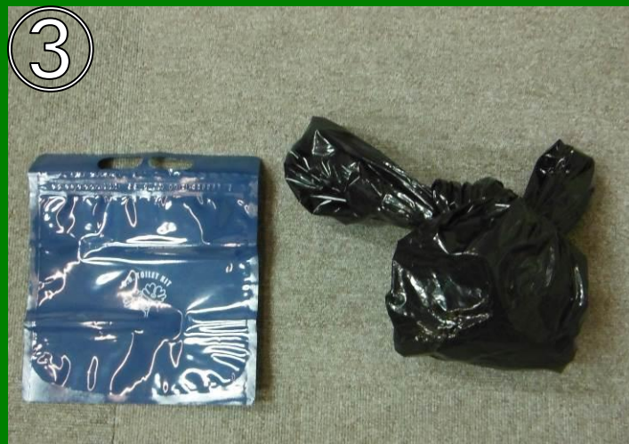
用を足した後、凝固剤を入れ袋を締める。