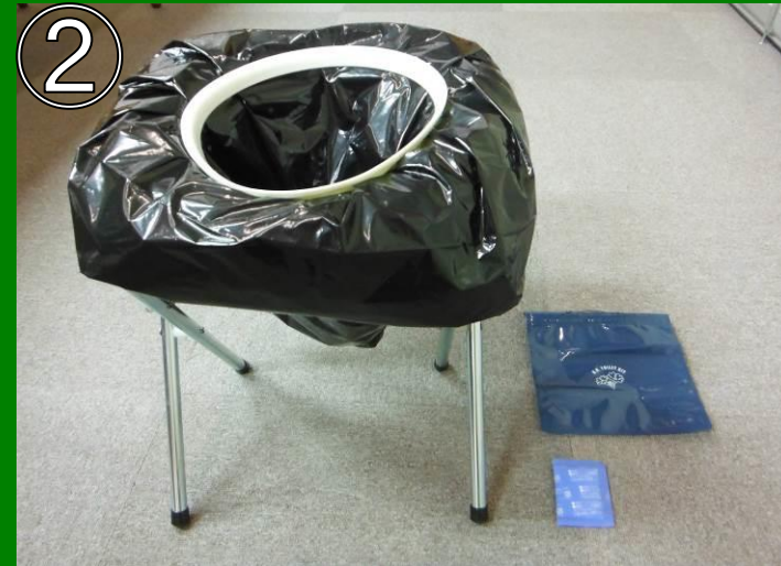
便袋をセットし、用を足す。