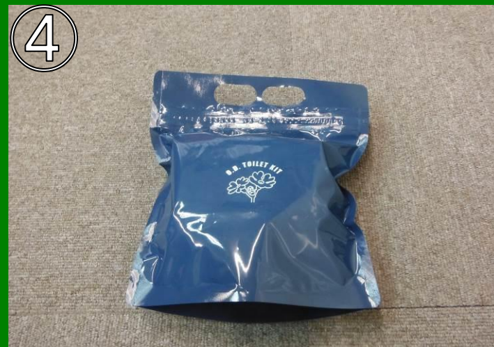
密封袋に入れ、持ち帰り、可燃ゴミとして処理する。