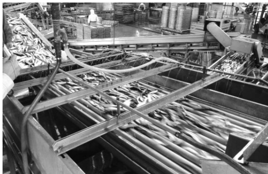
選別部分：間隔の調整可能なローラーに魚を流し魚体の幅により選別