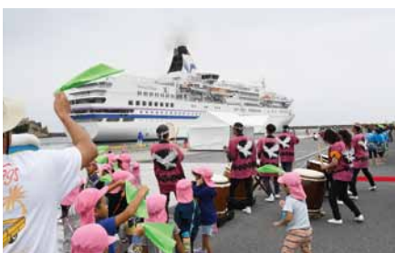
逢鷲太鼓連の和太鼓演奏と、緑のハンカチを振ってのお見送り。

賀露みどり保育園、賀露保育園の園児たちは、紙風船を飛ばして、セレモニーの出演者や岸壁に集まった人たちとお見送りに花を添えました。クルーズ客船からは紙テープが投げこまれ、岸壁からのお見送りに応えていました。