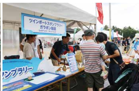
「ツインポートスタンプラリー」