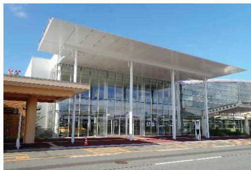
完成したターミナルビル

この日は、オープンに合わせ記念式典が行われたほか、空港と港のツインポートとして期待されている鳥取港のマリンピア賀露で、「食のみやこ 鳥取県フェスタ」が開催され、地場産の食材を使った料理などのブースでは、たくさんの人でにぎわいました。