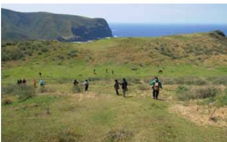
隠岐ジオパークでのフィールドワーク 【鳥取環境大学】