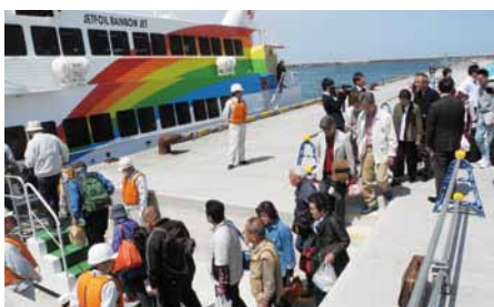
隠岐・西郷港に向けて乗船