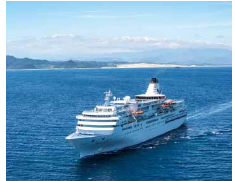
「ぱしふいっくびいなす」

出港に先立ち行われたセレモニーでは、和太鼓の演奏や郷土芸能披露、セレモニー出演者や、賀露みどり保育園、賀露保育園の園児がお見送りしました。