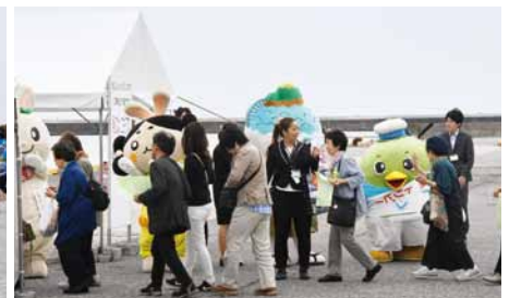
トリピーたちのゆるきゃらも乗船客をお見送り