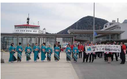
隠岐の島町長らによるお出迎え【西郷港】