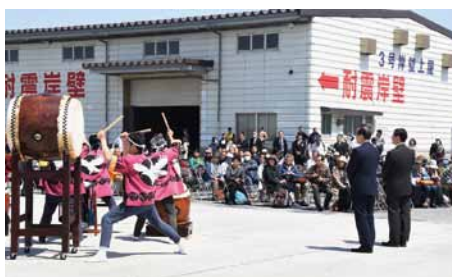
逢鷲太鼓や知事・副市長による歓迎

鳥取港では、関西や県内から隠岐へ向かうツアー客など、約100名が乗船。歓迎セレモニーでは、平井鳥取県知事、羽場鳥取副市長の歓迎挨拶、逢鷲太鼓連による和太鼓演奏や賀露・賀露みどり保育園児のダンス披露のあと、岸壁に集まった約100名が緑のハンカチを振り、出港を見送りました。