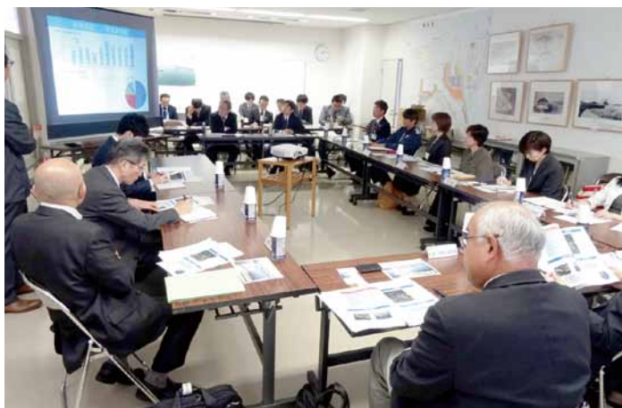
「長期構想検討準備会」の様子

船舶の大型化、取扱貨物、利用状況の変化や、自然環境の変化による航路の埋そく、静穏度不足などの課題の解決へ向けた、新たな動きがスタートしました。