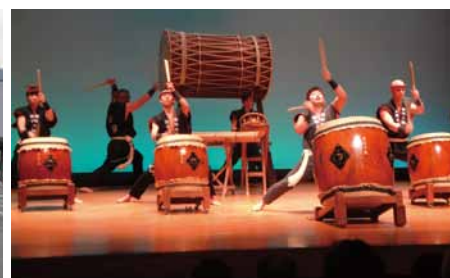
隠岐の歴史や自然を奏でる「隠岐太鼓」【隠岐島文化会館】