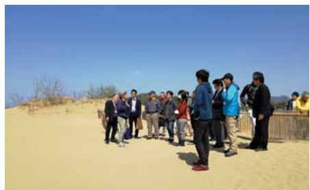
山陰海岸ジオパークでのガイド研修 【鳥取・島根 3ジオパークガイド】

隠岐と島根半島・宍道湖中海のジオパークガイドが来県され、山陰海岸ジオパークガイドらと一緒にガイド技術の向上を図りました。また鳥取環境大学生や鳥取商工会議所政策委員会が隠岐を訪問し、隠岐ジオパークでのフィールドワークや視察を行いました。