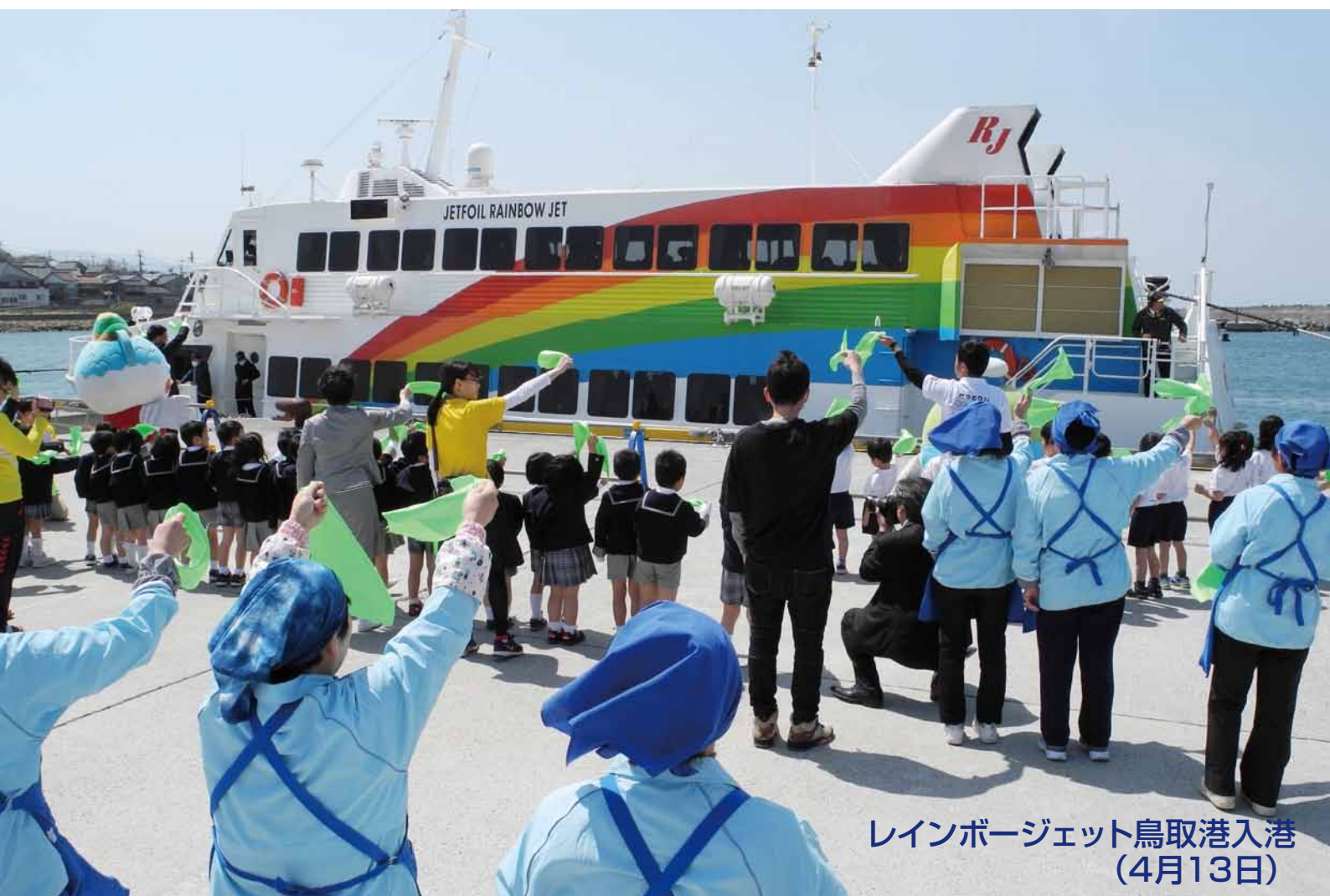
レインボージェット鳥取港入港 (4月13日)