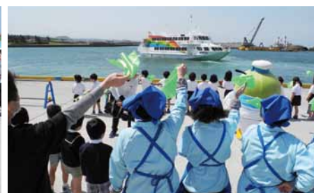
緑のハンカチを振ってお見送り