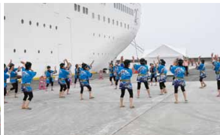
賀露町伝承芸能保存会のみなさんによる「元唄貝殻節」の披露