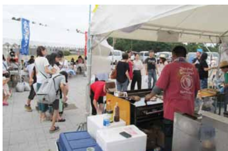
「食のみやこ 鳥取県フェスタ」