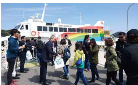
鳥取へ向かう韓国からのツアー客らをお出迎え【七類港】

チャーター便が寄港する七類港や西郷港でも、歓迎の横断幕や記念品等の配布、民謡「隠岐しげさ節」等による歓迎イベントが開催されました。また西郷港到着後には、運航に合わせ郷土芸能が披露され、関西や県内からのツアー客らは「隠岐民謡」や「隠岐太鼓」の演奏を楽しみました。