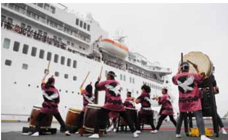
逢鷲太鼓連による勇壮な和太鼓演奏による見送り