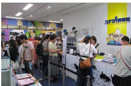
「名探偵コナン」のグッズ販売店