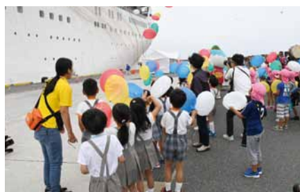
カラフルな紙テープが投げ込まれる中、紙風船を飛ばしてお見送り