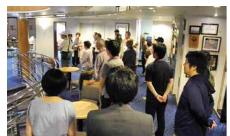
各種の催しが行われるホールや客室、ダイニングルームなどを見学

寄港時に実施したクルーズ客船船内見学会には、141名の応募があり、その中から抽選で選ばれた40名が見学されました。