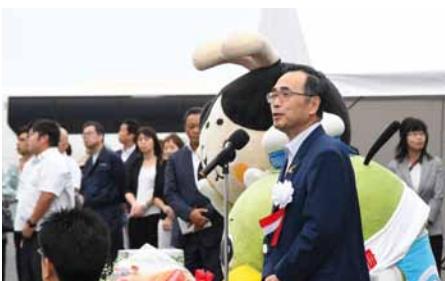
鳥取港振興会長（深澤市長）によるお見送りのあいさつ