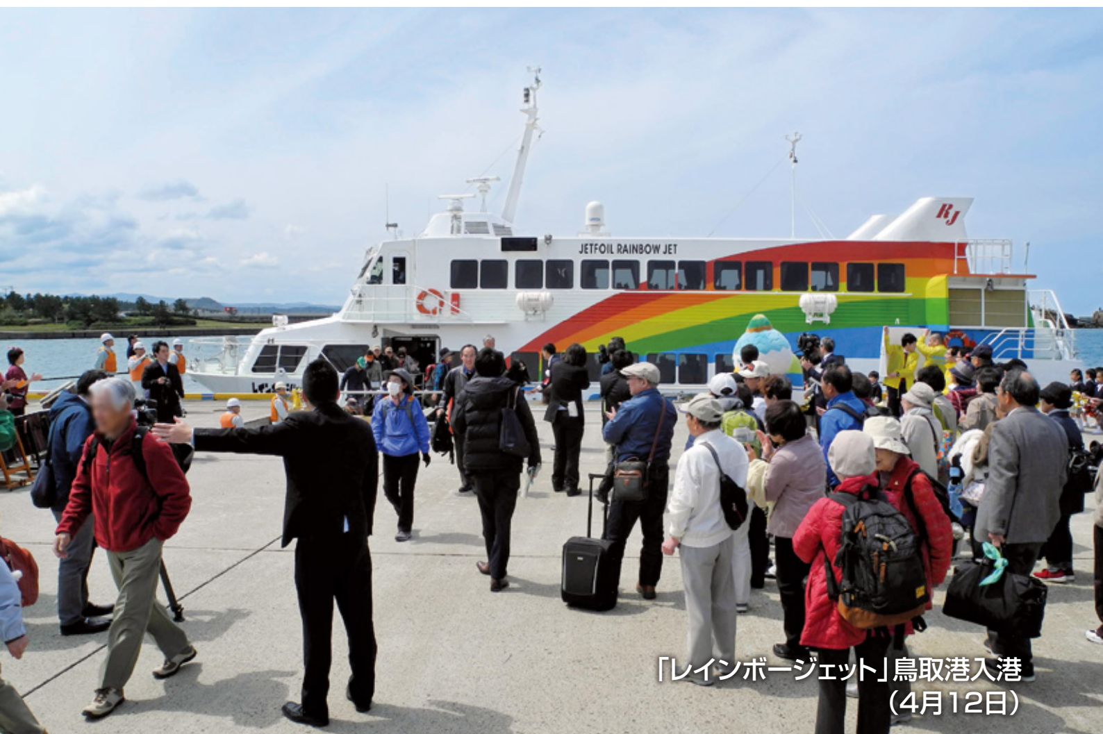
「レインボージェット」鳥取港入港 (4月12日)