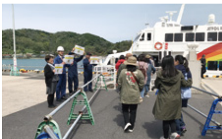
鳥取へ向かう韓国からのツアー客らをお見送り 【七類港】

チャーター便が寄港した七類港や西郷港でも、歓迎の横断幕や記念品等の配布、民謡「隠岐しげさ節」等による歓迎イベントが開催されました。また、西郷港到着後の夜には郷土芸能が披露され、乗船されたツアー客の方々は「東郷・今津神楽」や「隠岐太鼓」の演奏を楽しまれました。