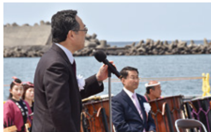
知事・市長による歓迎挨拶