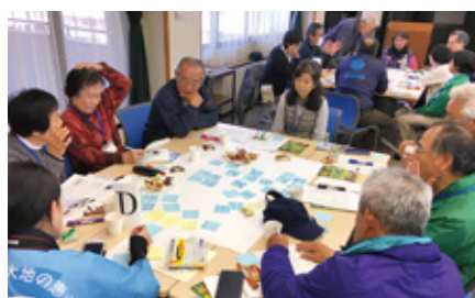
合同研修会でのワークショップ