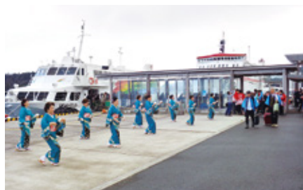
民謡「隠岐しげさ節」による歓迎 【西郷港】