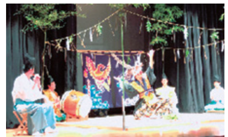
古来より伝わる「東郷・今津神楽」 【隠岐島文化会館】