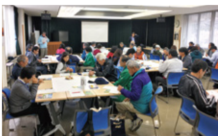
合同研修会の座学

「山陰海岸」、「隠岐」、「島根半島・宍道湖中海」のジオパーク関係者約60名(ガイド、事業者、行政関係者等)が隠岐に集まり、第1回目となる「山陰3ジオパーク合同研修会」が開催されました。座学や体験を通じた意見交換により、情報共有が図られ、3ジオパークの交流が深まりました。