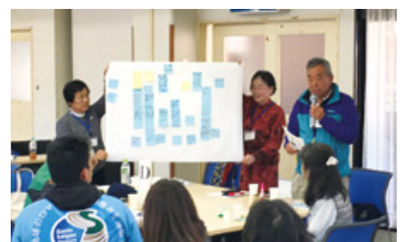
合同研修会でのグループ発表