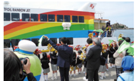
緑のハンカチを振ってお見送り