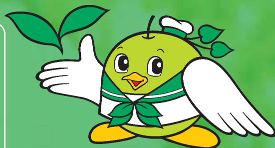
鳥取県環境政策キャラクター 「エコトリピー」