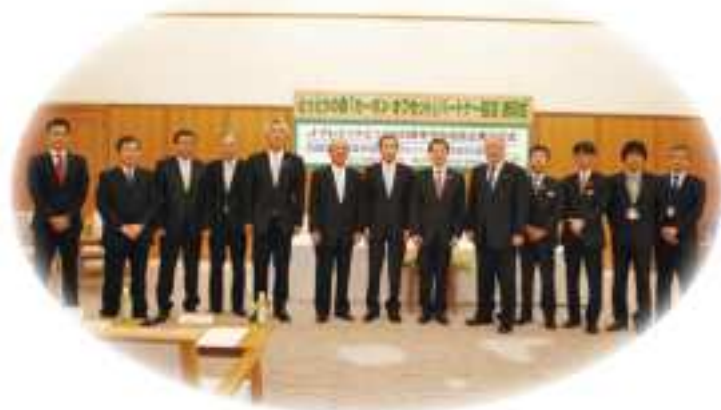
森林Jークレジットの購入をPR (やまこう建設株式会社とのパートナー協定調印・ 株式会社白兔設計事務所の優良企業認定)

皆さまのニーズに合った取組を御提案させていただきます。 あらゆる機会を取組をPRさせていただきます。