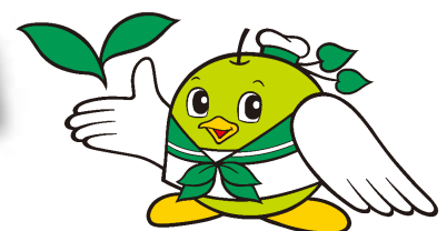
鳥取県環境政策キャラクター 「エコトリピー」