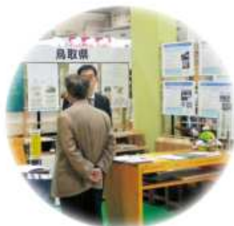
イベント等でカーボン・オフセットの取組をPR (エコプロダクツ 東京ビッグサイト)