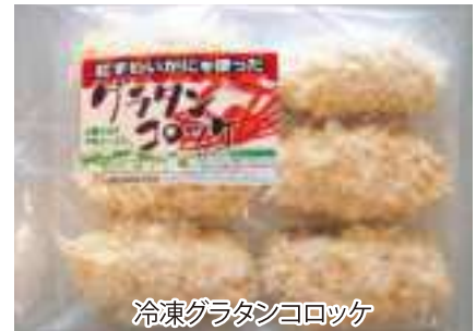
冷凍グラタンコロッケ