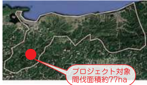
プロジェクト対象 間伐面積約77ha

鳥取県は、明治時代から土地所有者と分収契約を結び、森林整備に取り組んでおり、植林後も、保育・間伐などの管理を継続し、森林認証SGECを取得するなど、持続可能な森林づくりを進めています。