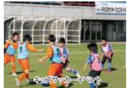
キッズサッカーイベント