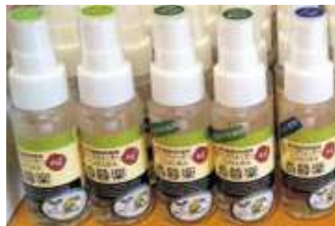
商品への使用例 赤松産業株式会社 消臭スプレー