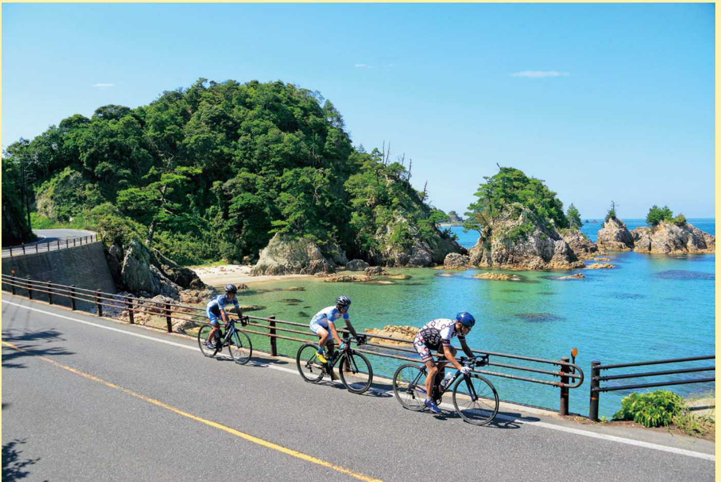
鳥取うみなみロード（岩美町 西脇海岸）