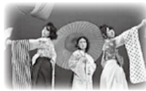
ファッションショー