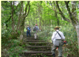
那岐山登山道整備の様子