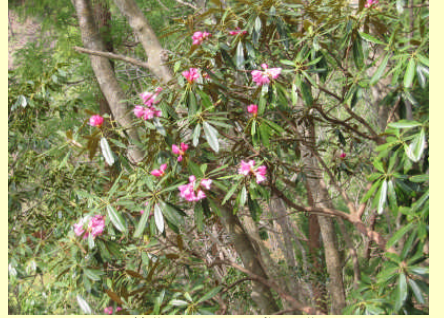
石楠花(しゃくなげ)の花