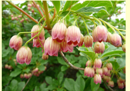
町花：どうだんつつじ(灯台躑躅)の花