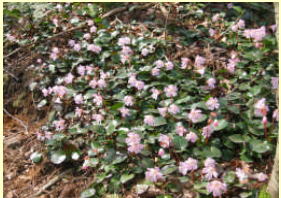
岩団扇(いわうちわ)の花

・前身の那岐山観光協会が、有名無実化しており、このままでは、良くないという声が上がリ、平成 16 年に組織自体を一新して、多くの方に那岐山を訪れてもらえるように、那岐山登山道の整備と周辺の環境美化を主とした目的で現在活動中。