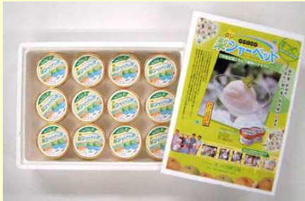
梨シャーベット（左側は贈答用）