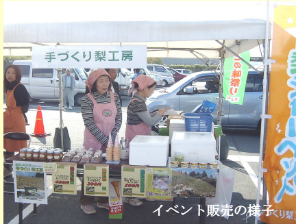
イベント販売の様子