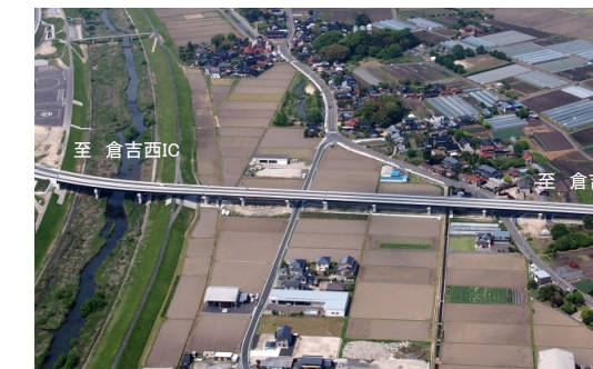
※不入岡大橋は国府川及び不入岡地区を南北に横断する、長さ589mの連続高架橋です。