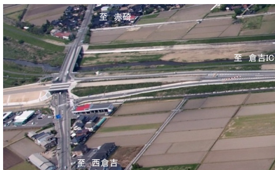
※倉吉市福光地区 倉吉西IC付近。