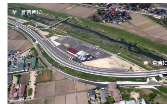
※倉吉市福守町地区(国府川右岸側)付近。