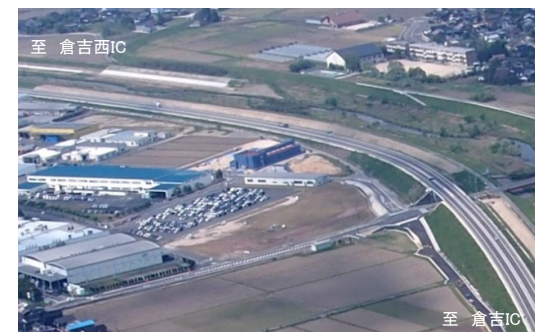
※倉吉市秋喜地区(西倉吉工業団地)付近。