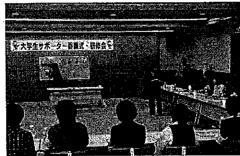
【非行防止教室実施要領の研修】