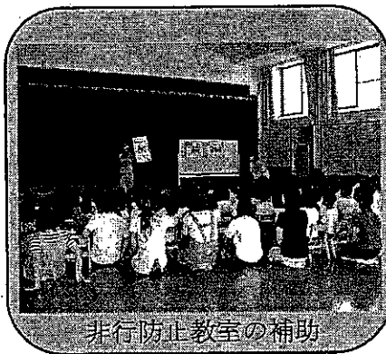
非行防止教室の補助