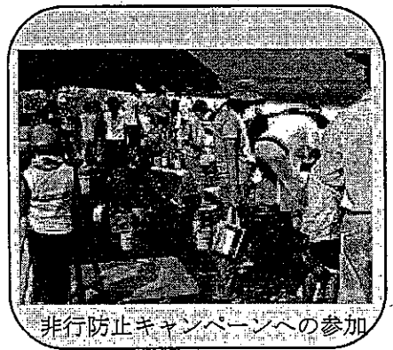
非行防止キャンペーンへの参加