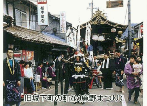
旧城下町の町並(鹿野まつり)