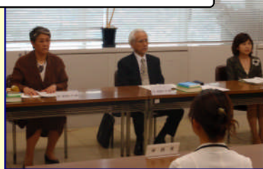
あっせんの様子(イメージ)