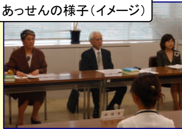
あっせんの様子(イメージ)