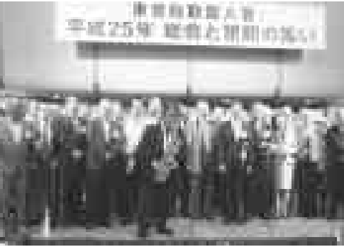
▲MALTAの吹奏で「ふるさと」斉唱

仲博は静岡に在る実の父組、徳川慶喜のものと兄と共に暮らした。親で乗馬や水泳、製糸工場、軍艦製作などして新しい時代の教育を受けた。鳥取県に育ちましたが、養父池田輝知はすぐれた政治家で、池田輝知の当主となつて、その時、仲博にとつ