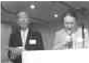
▲総会司会の萬治さん左と大場本部長