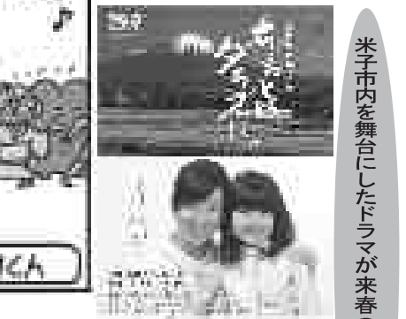
▲米子市内を舞台にしたドラマが来春(1/29)全国放送

NHK鳥取放送局が米子市を主な舞台にしたドラマ「ちよとは、ガラス」を制作した。 このドラマでは、東京から米子にやってきたシングルマザーが、米子の「ガラス」の楽しみ方を見つけていく。鳥取県の元気を全国に届けたい」と同局、下町情緒豊かな米子の風景もドラマの見どころの一つ。 放送予定：平成26年1月29日(水)午後10時BSプレミアムにて(全国放送) 出演：黒川智花、小林星蘭、童雷太、森昌子、古谷一行、たけなす、馬鹿(名)、愚か(名)の意 (森下喜一編 鳥取県方言辞典より) (森田美穂)