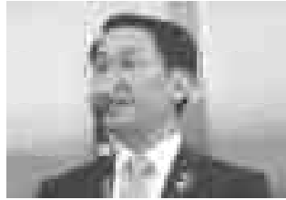
▲「とつとりのげんき印代表」平井知事