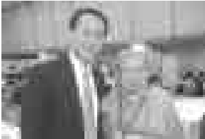
▲平井知事ともう一人のお