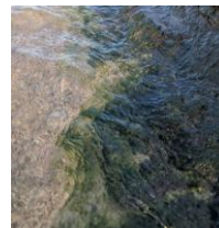
汽水域に自生しているが、見た目では他のアオノリとの区別が難しいので、最終的には遺伝子で判定している。

さらに探索を続けていきますので、県内で似たような海藻が生えているのを見かけたら教えてください。