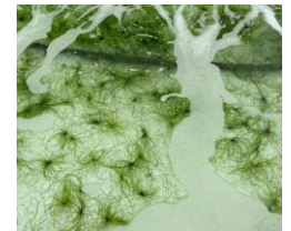
岩などに付着させず、浮遊状態で育てる養殖方法が確立されている。