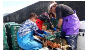
写真:採苗器設置の様子

また、同グループはアオナマコの増殖活動として稚ナマコ採苗器や育成礁の開発にも取り組んでおられ、これらの活動が評価されて今回の表彰に至りました。