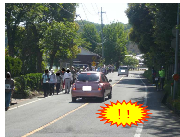
ウォーキングイベント時の状況