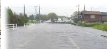
平成23年台風12号による道路冠水状況 東郷湖線(上浅津)