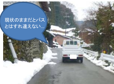
現状のままだとバスとはすれ違えない...