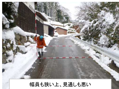
幅員も狭い上、見通しも悪い