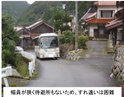
幅員が狭く待避所もないため、すれ違いは困難