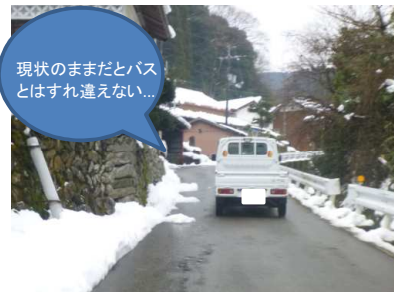
現状のままだとバスとはすれ違えない...