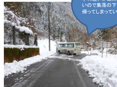
すれ違いが出来ない ので集落の下で 帰ってしまっている