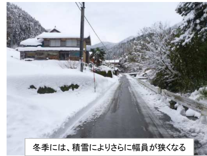
冬季には、積雪によりさらに幅員が狭くなる