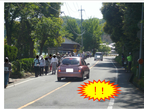
ウォーキングイベント時の状況