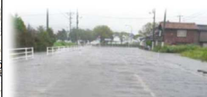
平成23年台風12号による道路冠水状況 東郷湖線(上浅津)