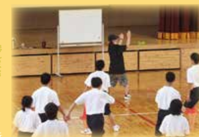
県立琴の浦高等特別支援学校