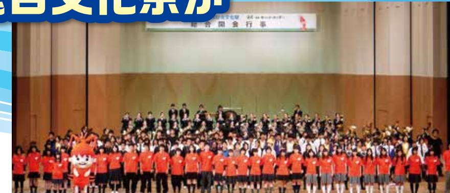
第33回近畿高等学校総合文化祭(三重大会)総合開会行事

全国高等学校総合文化祭と同じように総合開会行事が開催されるほか、計16部門で舞台発表、作品展示及び競技などが行われ、10府県の高校生が日頃の活動の成果を披露します。この中には他府県で開催