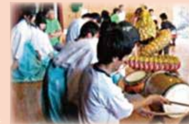
県立米子養護学校