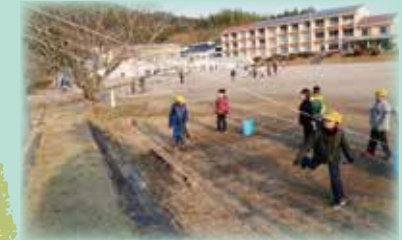
南部町(会見小学校)