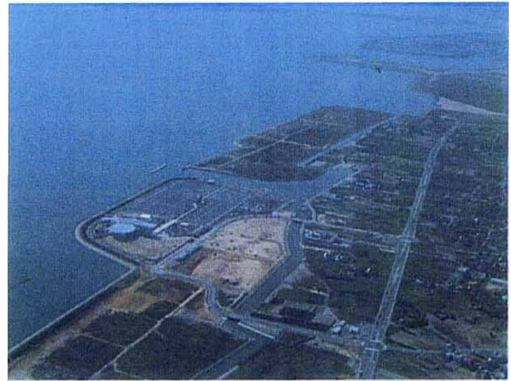
米子崎津地区工業団地