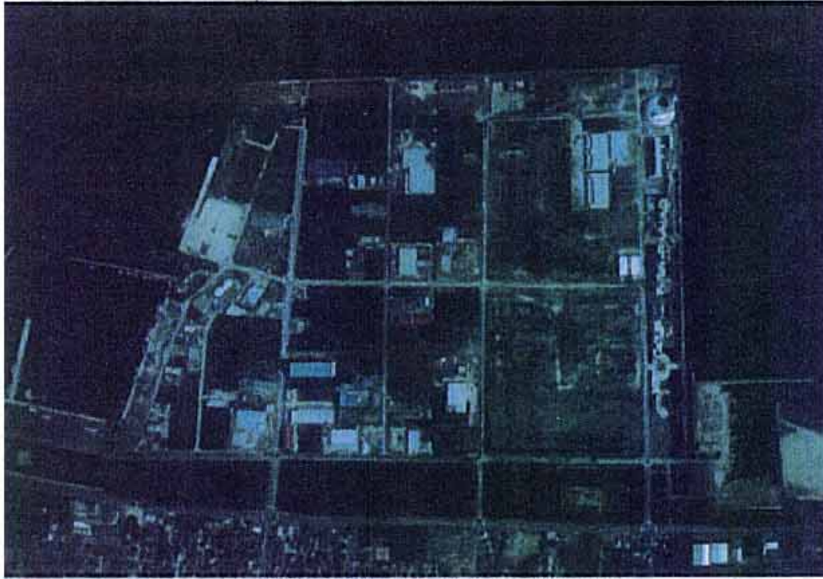
境港外港竹内地区工業団地