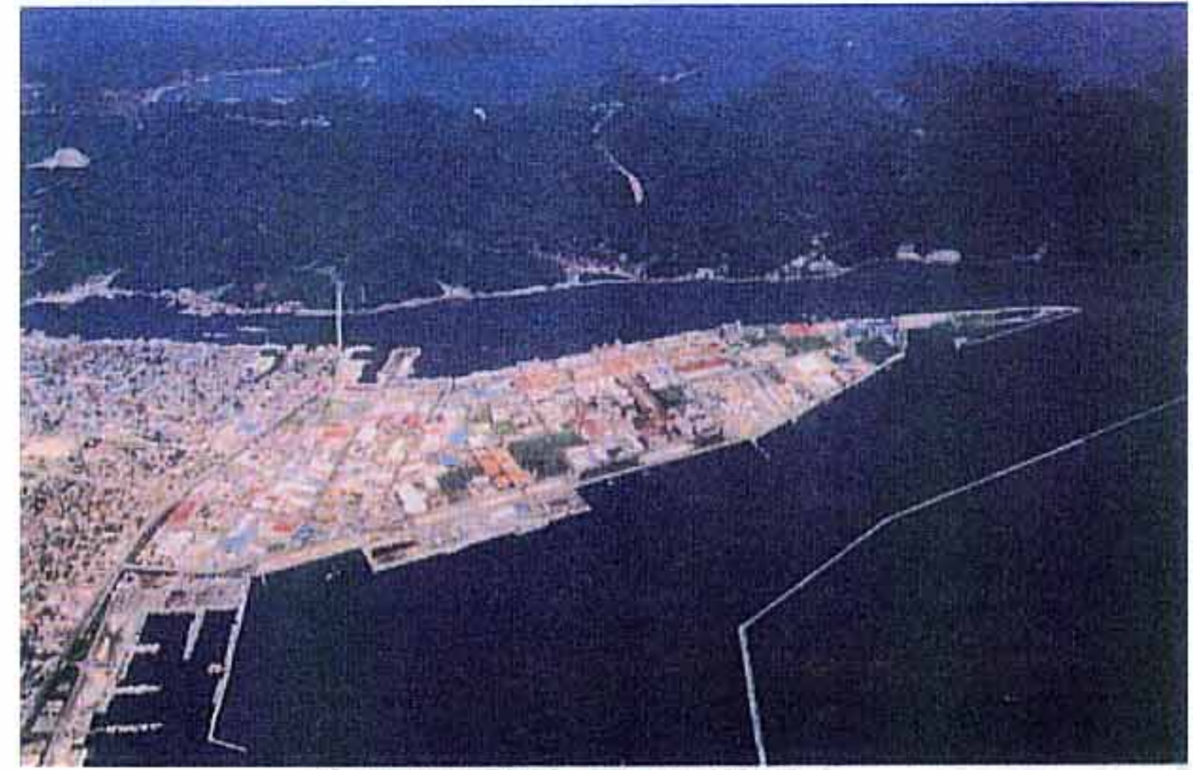
境港外港昭和地区工業団地