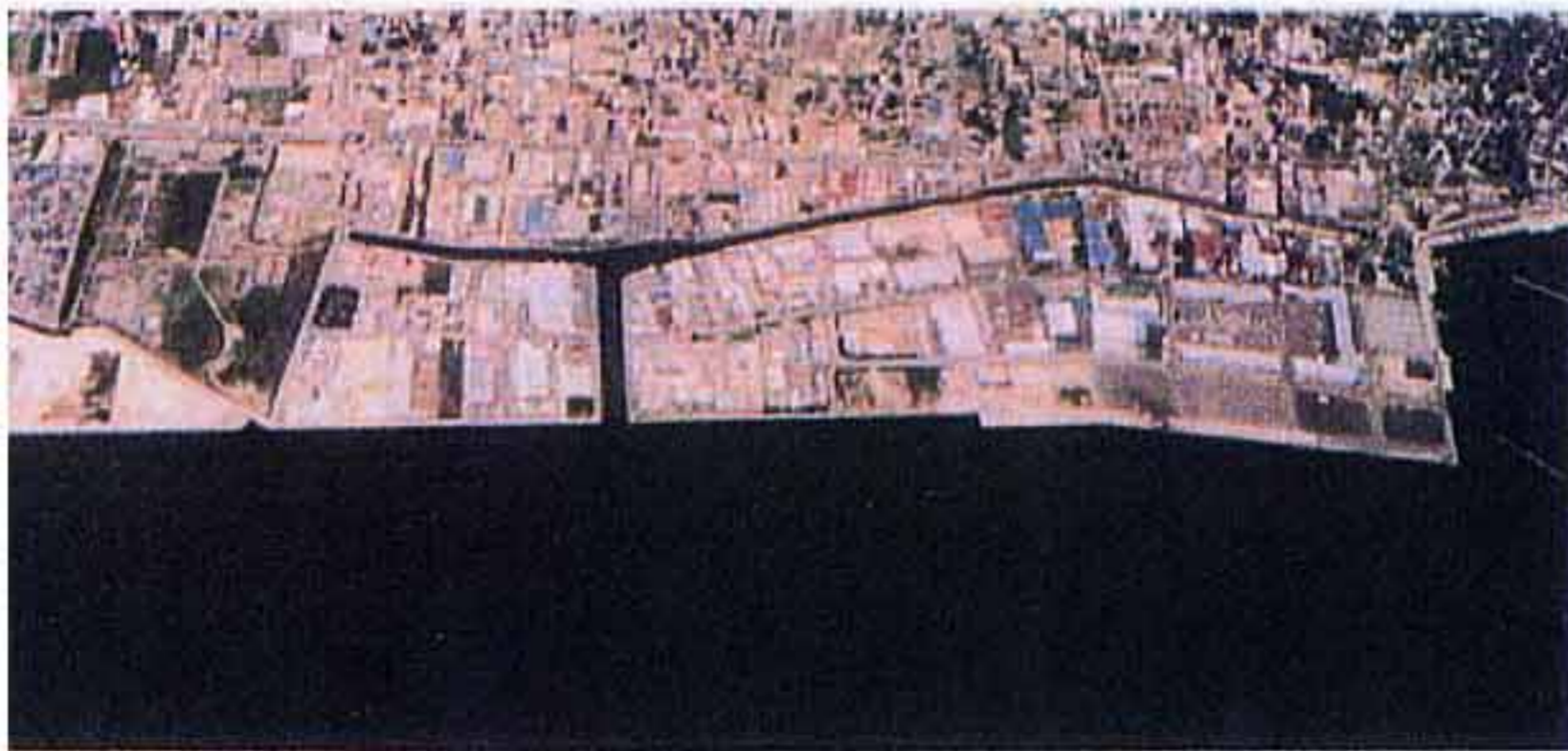
米子港旗ヶ崎地区工業団地