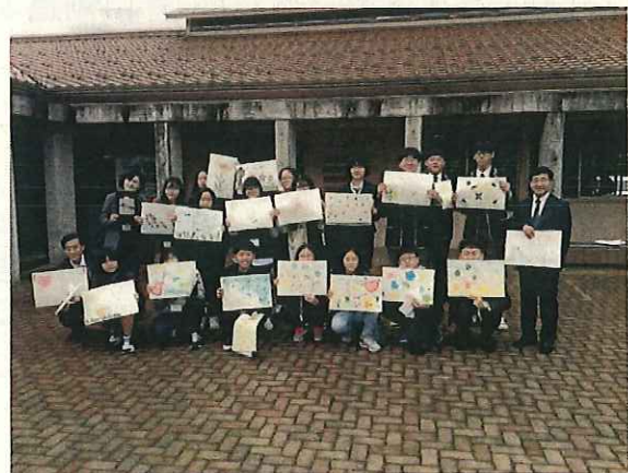
(完成作品を手に記念撮影)

高校生の芸能団が総合文化祭のリハーサルに臨んでいる間、交流団は紙すきを体験しました。思い思いの模様をちりばめたオリジナル作品が完成しました。