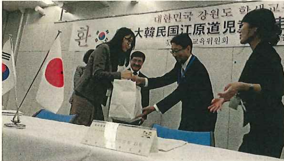
(教育長から児童生徒に和紙メモ帳のに記念品贈呈)

教育長から「一番楽しみにしていることは何ですか、蟹ですか?」の問いに、児童生徒からは元気よく「一回ぐらい食べさせて〜」の声があがり、終始和やかな歓談となりました。