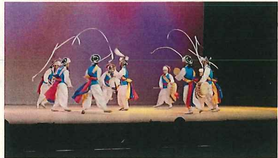
(軽快な音楽とアクロバティックな演舞)