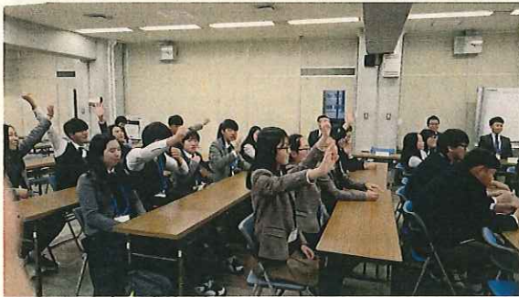
(名探偵コナンを知っている人は挙手!)