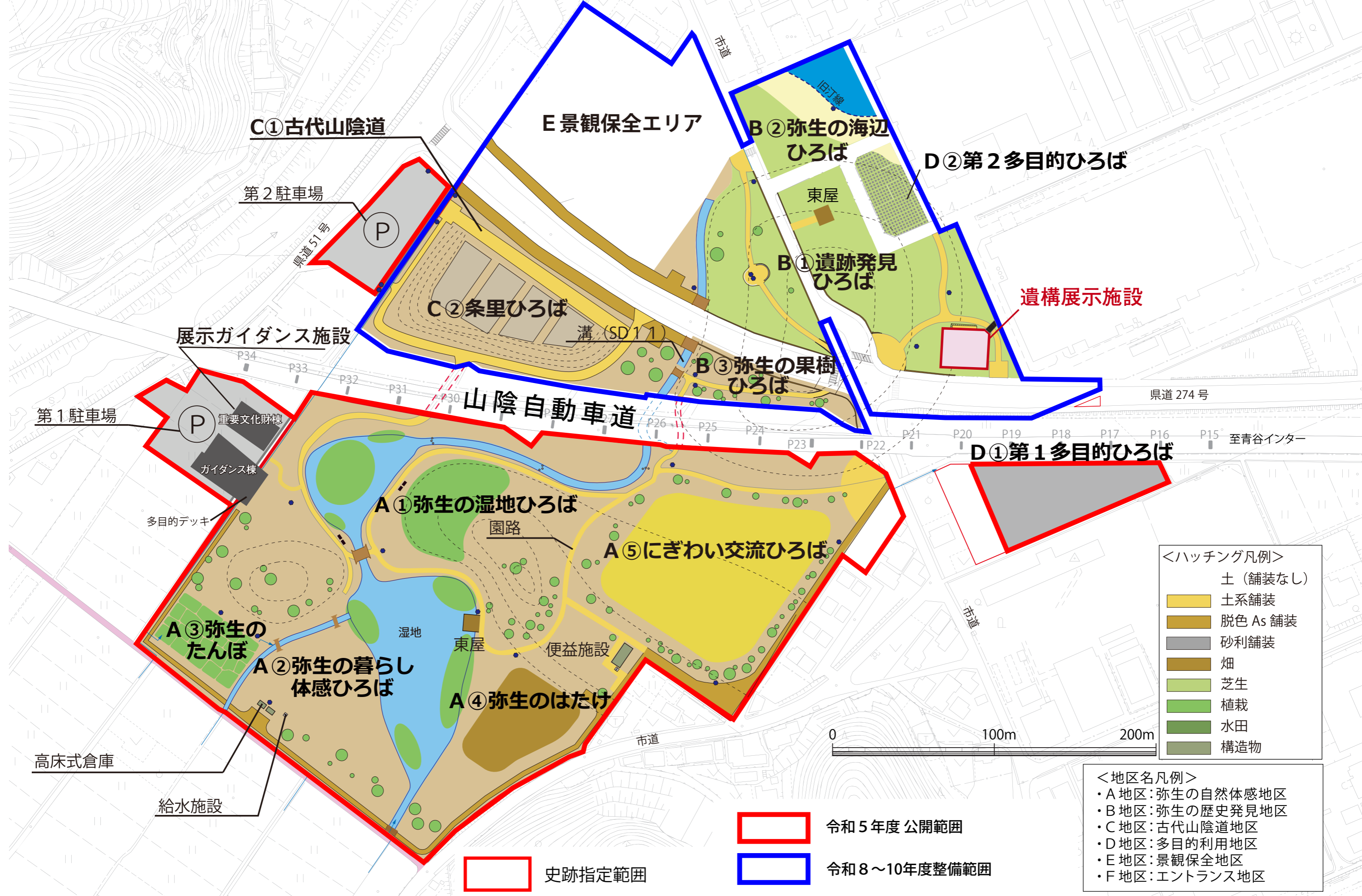
【別紙】遺構展示施設位置図