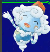
地球の妖精 ラテール