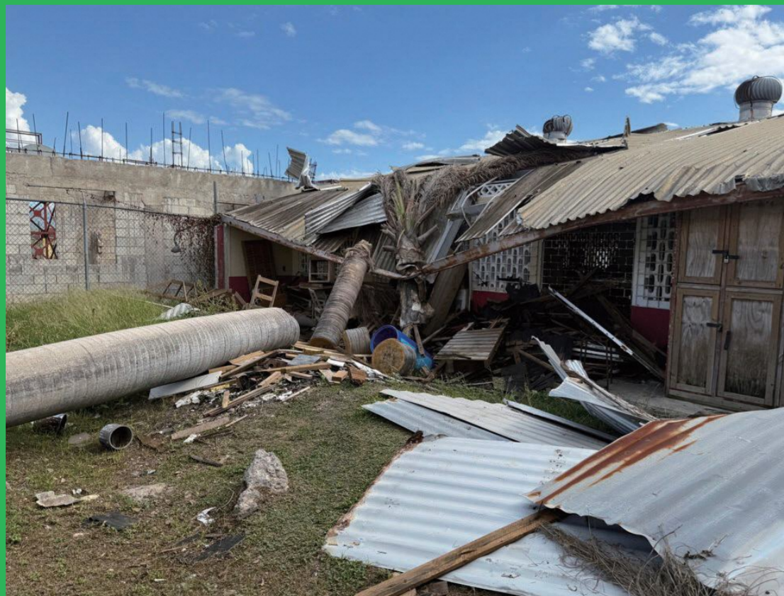
倒れた木が建物を直撃