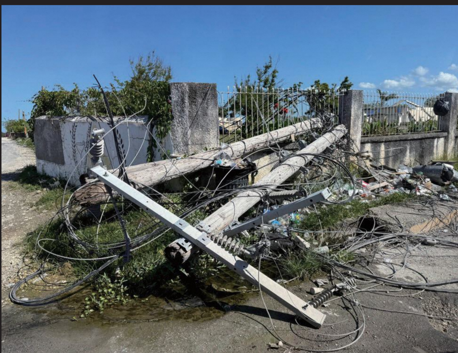
電信柱の倒壊により街全体で停電が発生