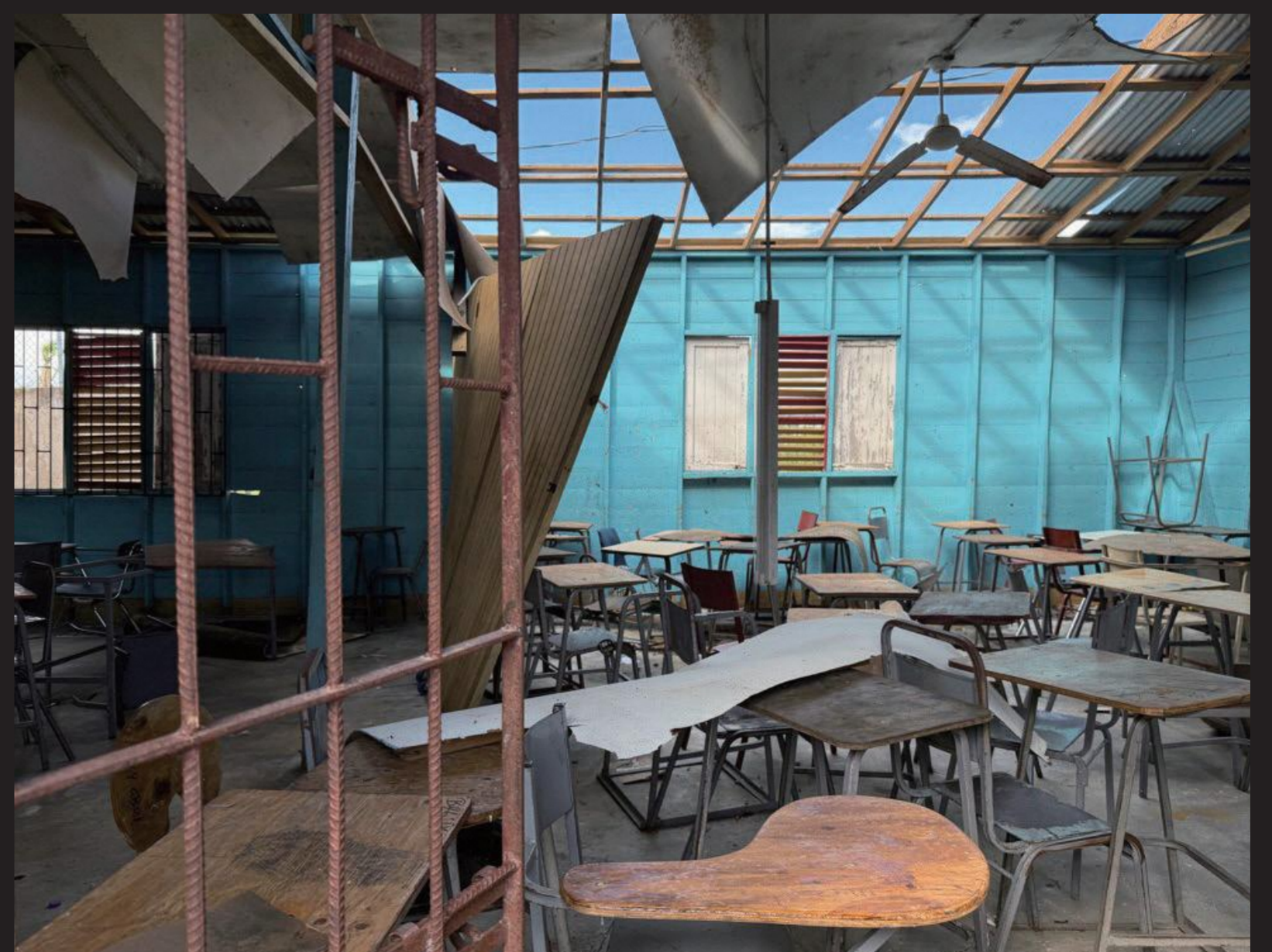
屋根が吹き飛ばされたゴッドフレイ高校の教室