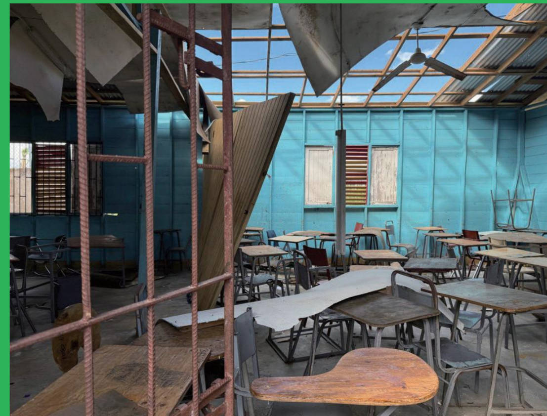
屋根が吹き飛ばされたゴッドフレイ高校の教室

<問い合わせ先> 鳥取県交流推進課 ジャマイカ交流担当(0857-26-7842)