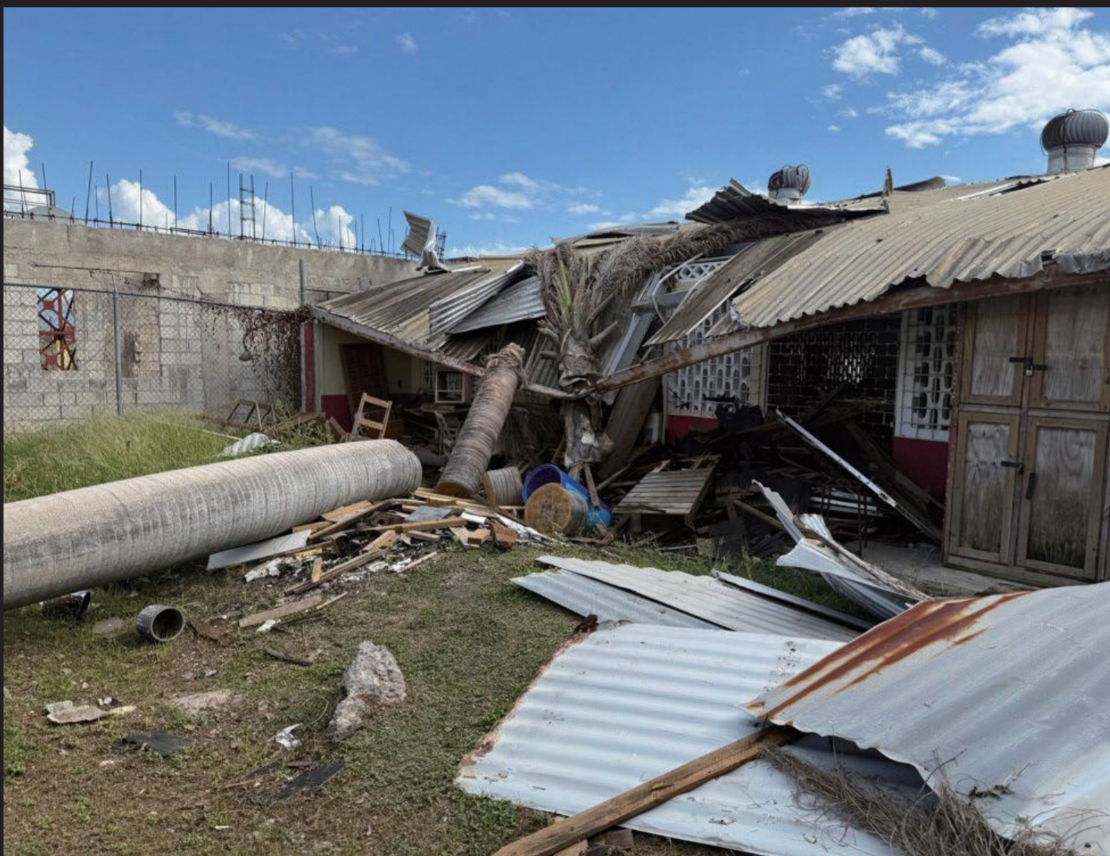
倒れた木が建物を直撃