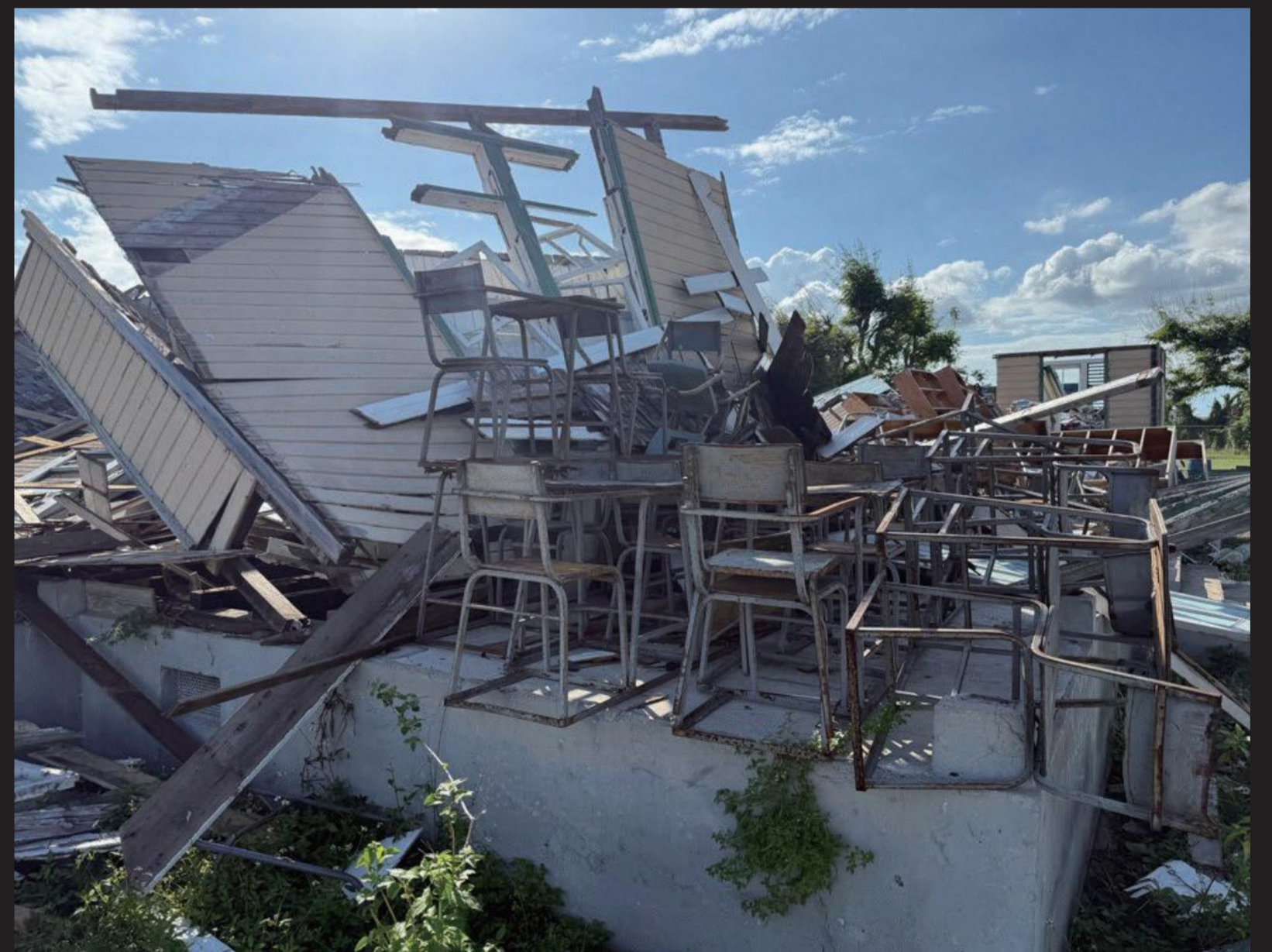
全壊したマニングス高校校舎