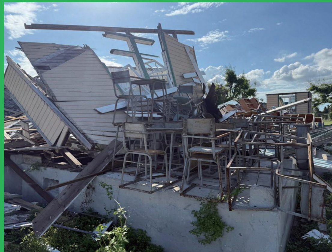
全壊したマニングス高校校舎