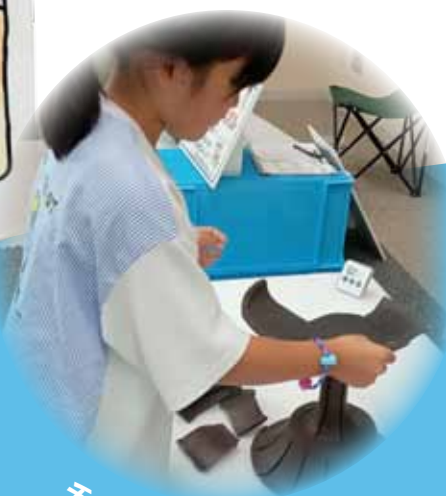
チャレンジ!土器パズル