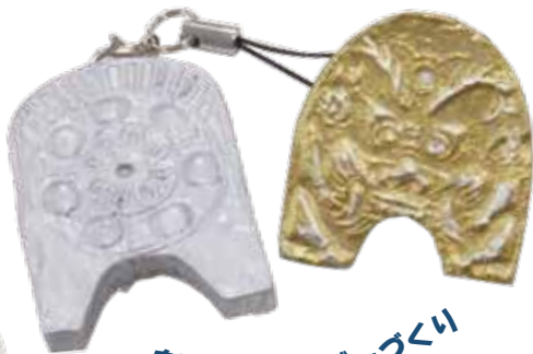
鬼瓦キーホルダーづくり