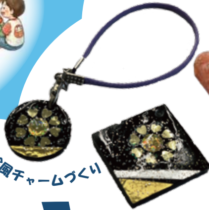
時絵園チャームづくり