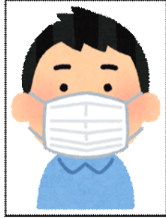
マスクを着用している