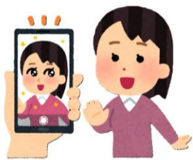
アプリで加工している