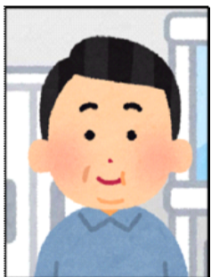
背景に不要なものがある